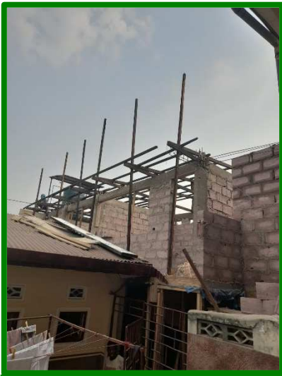
Les murs montent