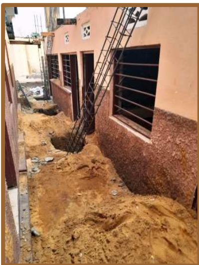
Le début des travaux

et aussi l'accueil des parents en vue des inscriptions pour la nouvelle année scolaire. Nous sortons fatiguées, bien sûr, mais aussi remplies de joie, de gratitude et d'espérance de voir fructifier les efforts et la générosité de nos bienfaiteurs. »