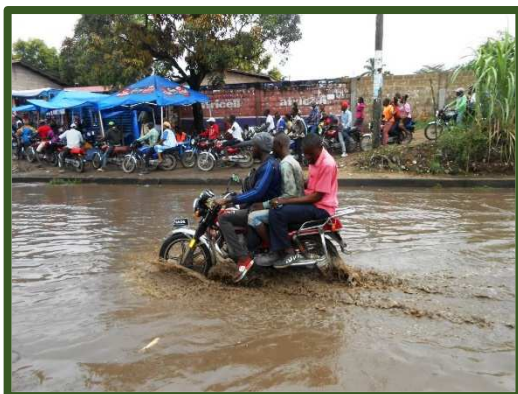
La rue inondée lors des fortes pluies

En ces temps de crise, nous sommes constamment sollicitées pour toutes sortes d'aides ; ainsi, grâce à vous, nous avons pu parrainer plusieurs enfants orphelins pour leurs frais scolaires ; nous avons pu soutenir plusieurs familles très pauvres de notre quartier, soit pour l'achat de nourriture ou de produits de première nécessité comme des vêtements ou des sandales, soit pour des soins de santé, en particulier une maman opérée d'un nodule au sein, soit à l'occasion d'un deuil ; nous avons également contribué à l'achat de sacs de sable indispensables pour contenir les inondations dans notre avenue en cas de fortes pluies et éviter ainsi la montée des eaux dans les habitations.