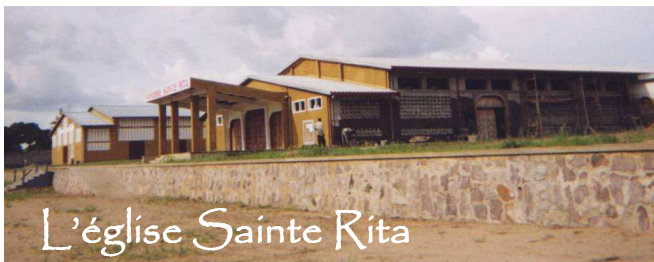
L'église Sainte Rita